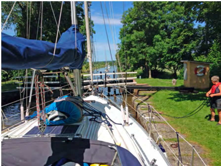
Kanalfärd handlar mycket om hantering av linor.

Klubbaftonen den 17 mars inleddes med en berättelse av Lennart Beckman från en färd på Göta Kanal. Vi fick många praktiska tips om hur man bär sig åt vid slussning och om att färdas på kanalen. En liten, men viktig, detalj är