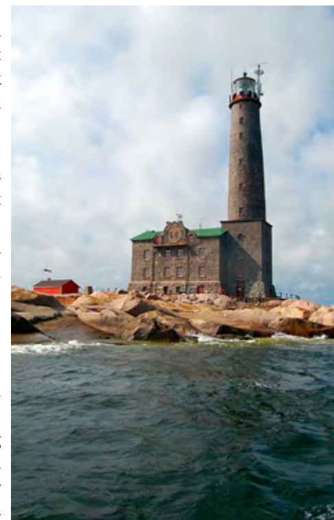
Ett besök på Bengtskärs fyr i Finska viken finns med i planeringen.