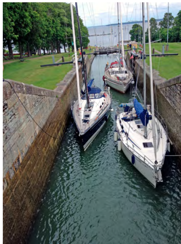
Så kan det se ut ifrån slussporten.

Birka är naturligtvis en värdefull källa för kunskap om vikingarna, och avslutningsvis berättade Jens om utgrävningarna där och passade också på att bjuda in till besök på sommarens öppna hus om de marinarkeologiska utgrävningarna av den forntida hamnen på Birka.