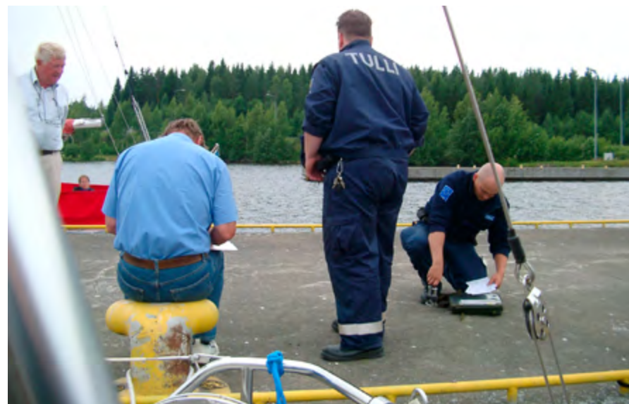
Ovan: Finsk tull och gränsbevakning hade en avslappnad attityd. Nedan: Slussarna är stora och djupa.

Färden på ryskt vatten och i ryska delen av kanalen får bara ske i dagsljus och utan övernattnig, varför vi startade tidigt efter att på radio ha bokstaverat alla båtnamn till den ryska kustbevakningen. I Brusnitchnoe, som är första sluss i kanalen, fick vi hjälp av en vänlig rysk tjänsteman att göra ytterligare kopior av våra båtcertifikat, vilket av någon anledning krävdes. Vi fick snart rutin i slussningen och det gick undan ända till Pälli, som är sista sluss på den ryska delen. Där blev det tvärstopp, först på grund av annan trafik, men framför allt på grund av mycket utförlig visitation av båtarna och kontroll av passen, vilket tog över fem timmar. När vi äntligen fick fortsätta var det nermörkt, men vi hade inget val utan fortsatte till Nuijamaa, som är första hamn på finska sidan. Dit kom vi halv två på natten och hälsades välkomna av en