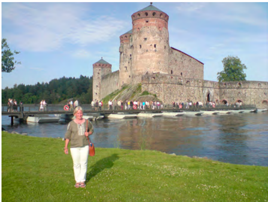
På väg till kvällens föreställning.

I Savonlinna låg vi två nätter och andra kvällen såg vi, som planerat, Madame Butterfly. Operafestivalen äger rum på fästningens borggård med tältduk spänd över som skydd. En kväll att minnas, alltifrån den uppklädda publiken som vandrade över bron till fästningen till atmosfären i den ljusa sommarnatten när alla återvände hemåt via diverse serveringar.