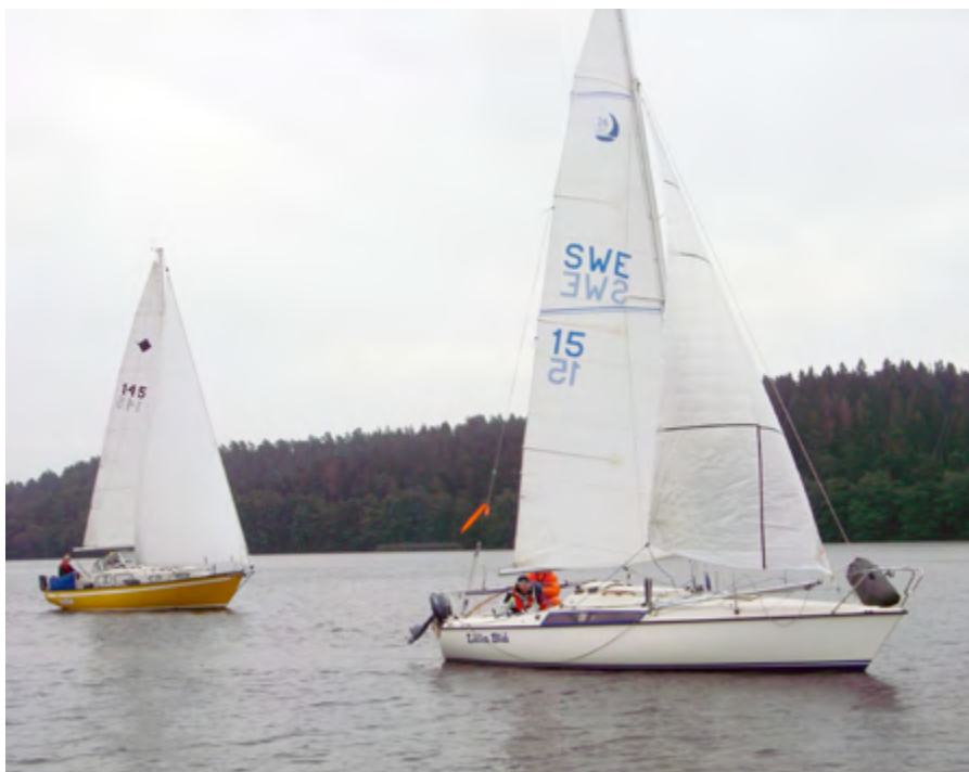
Kampen tätnar. Från Höstkvarten 2012.