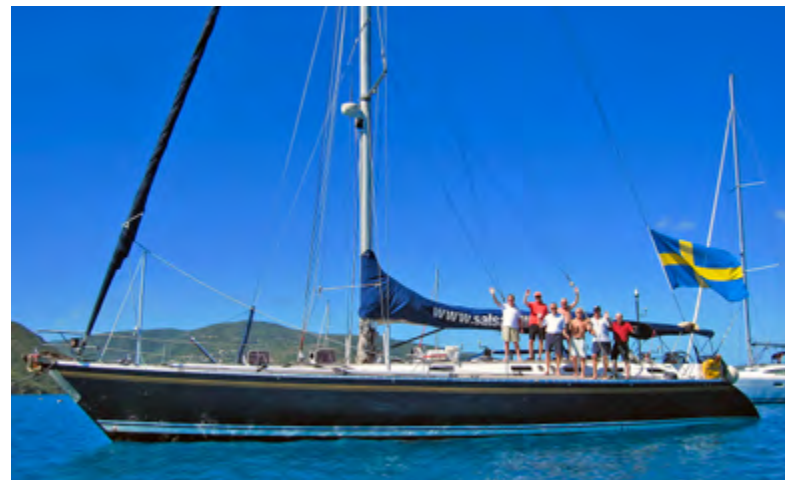
S/Y Salsa.

Kjell Lindberg tipsade vid 6-timmarskommitténs julbord om S/Y Salsa, som är en 64 fots Scandinavian Eagle med svensk skeppare. Båten är mycket bekväm och utrustad med all modern utrustning vad gäller komfort och säkerhet. Salsa är en stor och skön yacht med sex hytter, rymlig sittbrunn, salong, flera toaletter, kylar och badplattform.