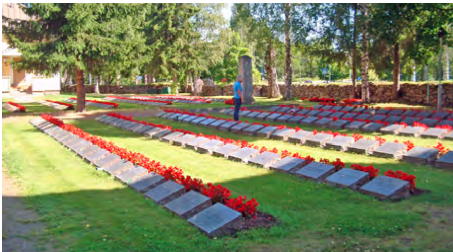
Varje finsk kyrkogård har en särskild avdelning för de stupade i kriget. Den sköts än idag minutiöst.

Via Porkala och Hangö gick resan vidare, men nu började diverse plikter hemma dra i flera båtar varför det var en något reducerad grupp som så småningom åt en god avslutningsmiddag på Lidö värdshus. Då hade vi ändå hunnit besöka en del av Åbolands och Ålands fantastiska skärgård. Så kunde vi knyta fast vid hemmabryggan efter drygt sex veckors intressanta upplevelser.